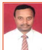
S Ravi Shankar