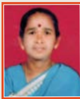
Subbalakshmi Hospital Attendant Nursing