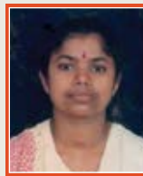
Remachandran Lab Technician Diagnostic Centre