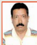
Manjunath M Hospital Attendant Nursing