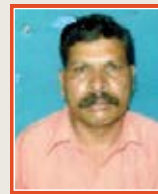
Narayana N Watchman Security