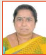
Shivamma Hospital Attendant Nursing