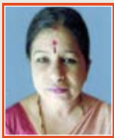
Syamalammal V Hospital Attendant M.R.D