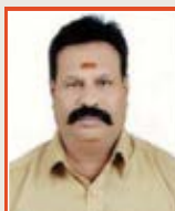
Narayanaswamy D Hospital Attendant M.R.D